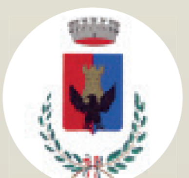
Comune di Maenza