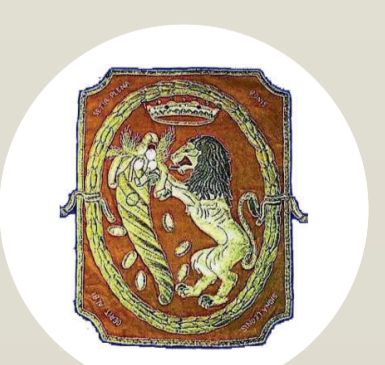
Comune di Sezze

Tutte le informazioni disponibili su www.compagniaideilepini.it