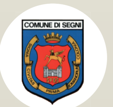
Comune di Segni