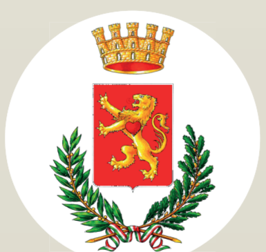
Comune di Cori